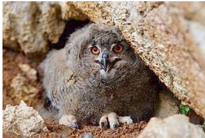
Hibou grand duc d'environ 4 semaines

Tu sais déjà beaucoup de chose... tu veux en connaître plus sur ma vie de famille ? Et bien, moi Bubo bubo je vis en moyenne 20 ans. Je suis uni en couple pour la vie. Ma femelle pond entre un et quatre œufs à la fin de l'hiver. A l'automne, les jeunes quittent le nid.