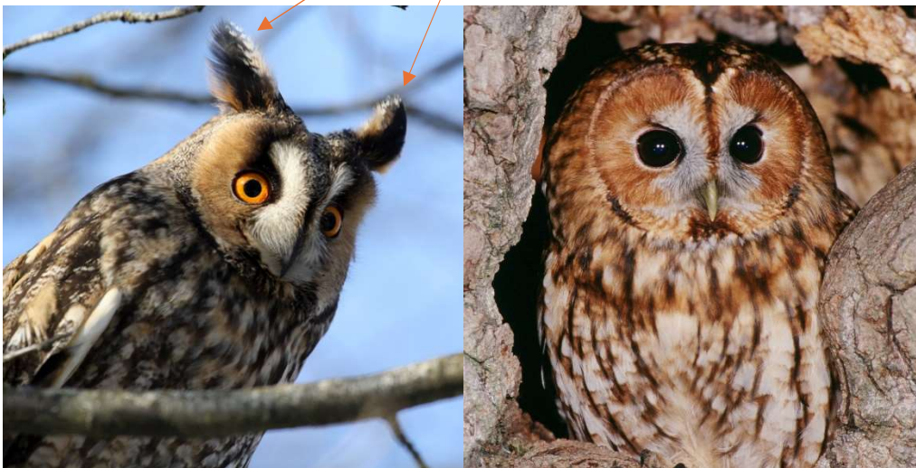
Je suis le HIBOU

Mes AIGRETTES (qui ne sont pas mes oreilles !)