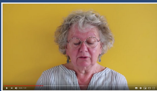
Exemple d'un bon cadrage